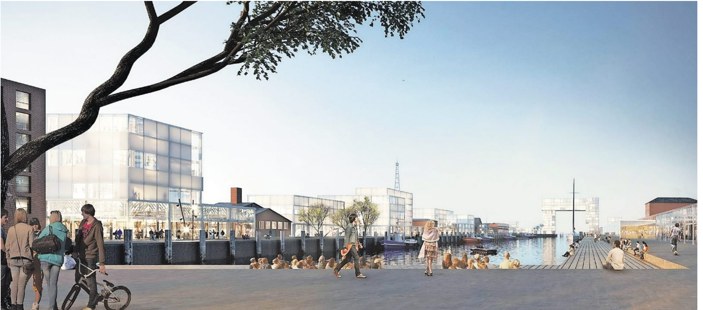
Die Animation des Büros Holzer Kobler zeigt die Gesamtansicht auf den Hafen vom Südende am Dugekai aus. Die Sturmflutmauer ist verschwunden, im Vordergrund genießen Gäste von einem vorgebauten Holzsteg aus den Blick auf den Hafen. Das Eingangstor zum Hafen bildet ein gigantisches gläsernes Bauwerk, das im Wesentlichen ein Businesshotel beherbergen könnte. Animationen: Holzer Kobler